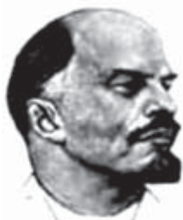
व्ला. इ. लेनिन

अक्सर लोगों को यह कहते सुना जाता है कि जमींदार या व्यापारी लोगों